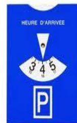
modèle obligatoire pour 2012