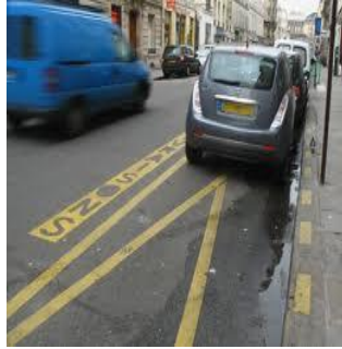
Livraison. Stationnement interdits.