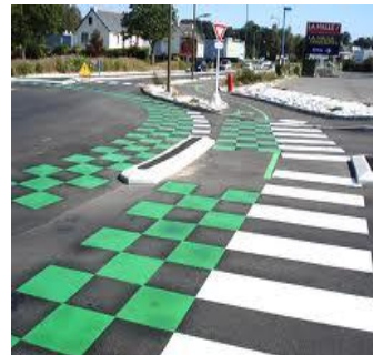
Traversée de chaussée.

On peut couper la voie pour quitter une rue ou l'aborder.