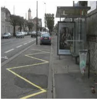
Zébra d'arrêt de bus. Stationnements et arrêts interdits.