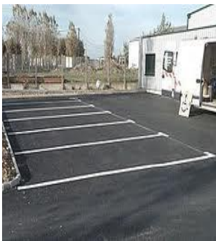
Bataille. Se ranger de préférence en arrière.