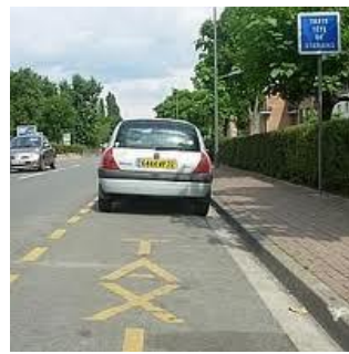
Taxis. Arrêts et stationnements interdits.