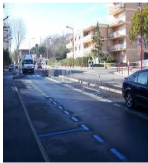
Zone bleue. Stationnement gratuit. et limité