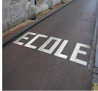
Proximité d'une école.

Ces derniers sont prioritaires. L'arrêt ou le stationnement sont interdits dessus et à proximité.