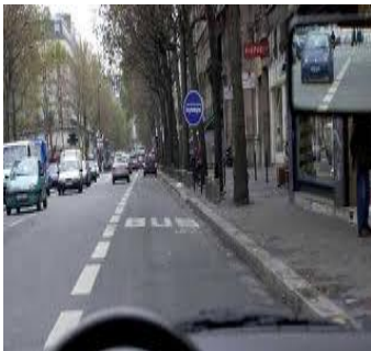
Voie de Bus.

Ces derniers sont prioritaires. L'arrêt ou le stationnement sont interdits dessus et à proximité.