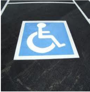
Emplacement pour personnes handicapés . Arrêt et stationnement interdits.